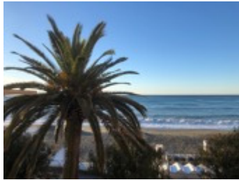
Blick aus einem der Fenster

Neu restauriertes Einzimmerapartment (22 qm) in einem charakteristischen Fischerhaus des 17. Jahrhunderts in einem der schönsten Badeorte Liguriens (vergleichbar mit Portofino). Direkt an der Meerpromenade ohne Durchgangsverkehr (absolute Rarität an der Küste!) gelegen, mit Blick auf das Meer aus den beiden Fenstern.